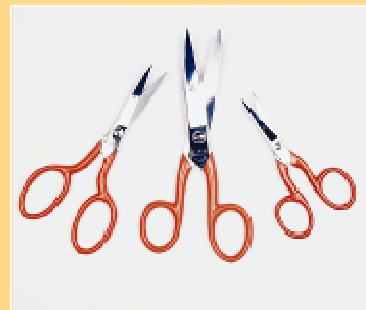
Scheren, gebogene Klingen