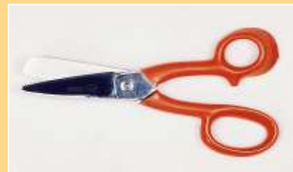
Schere 33, Kraftschere gezahnt