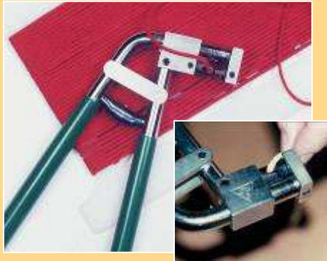
Pinkenzange „PINK DOLLY“ für Senkelenden (Normal-Pinken und Mini-Pinken)