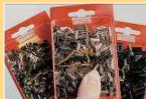
Normal-Pinken und Mini-Pinken für feine Schnür- und Gummisenkel